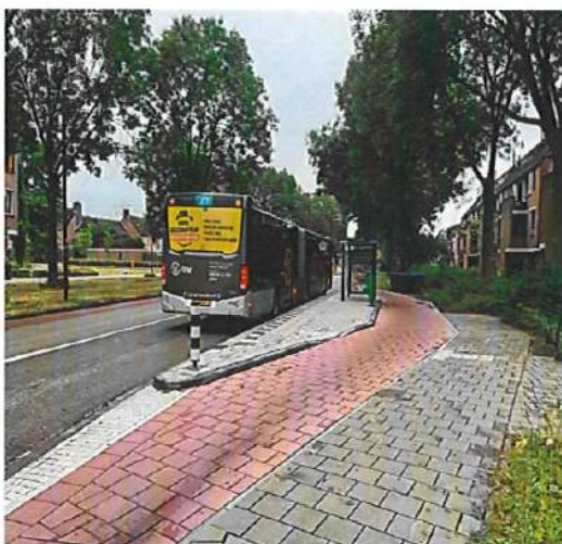
Voorbeeld eindsituatie Bushalte

In 2021 is het Mobiliteitsprogramma Nieuwegein 2021 – 2030 door de gemeenteraad vastgesteld. Eén van de maatregelen die hierin opgenomen zijn is het halteren van de bus op de rijbaan. Hierdoor wordt het veiliger voor de fietsers, men hoeft de bus niet meer te passeren en op de bus te wachten. Verder bespaart het tijd voor de bussen.