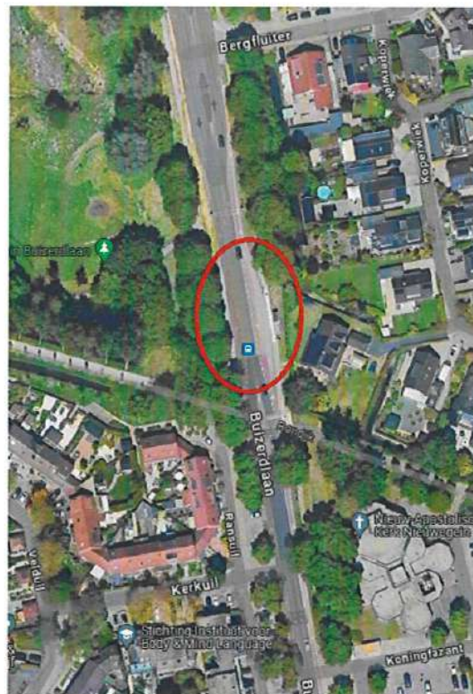
Overzichtsfoto locatie werkzaamheden

De werkzaamheden worden in 2 fasen uitgevoerd. Hierdoor hoeft de weg niet geheel afgesloten te worden en wordt het verkeer met tijdelijke verkeerslichten om en om over één weghelft geleid. (Brom)fietsers worden gedurende de werkzaamheden omgeleid. Tijdens de werkzaamheden is de rijbaan aan de zijde van de bushalte afgesloten, de andere rijbaan blijft open.