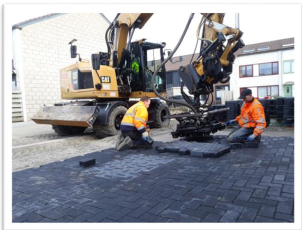
Nieuwe parkeervakken leggen we aan

www.ikbennieuwegein.nl voor de actuele stand van zaken.