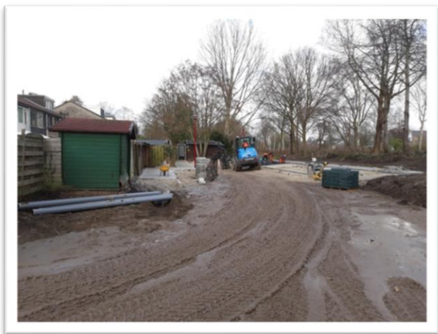
Rijtuigenbuurt in uitvoering